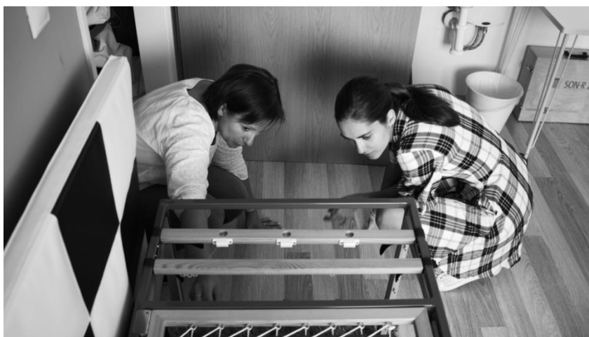
V priestoroch Centra včasnej intervencie Bratislava